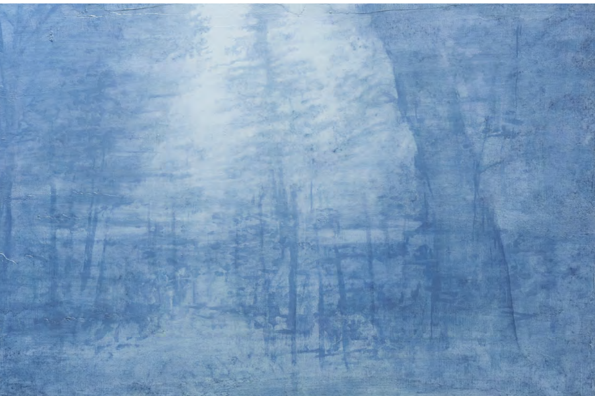
Rasgar la niebla III, óleo-lino, 53,5x80,5, 2016