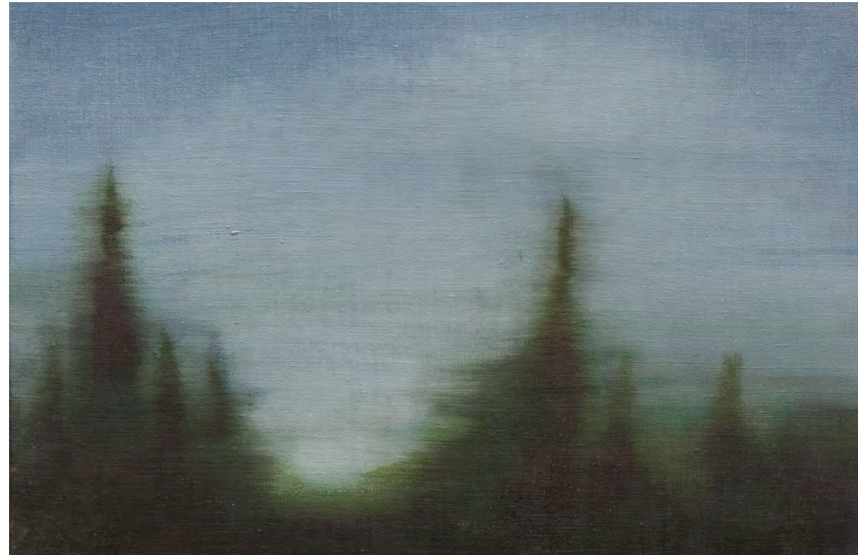
Cipreses antiguos, óleo-lino, 27x41, 2014