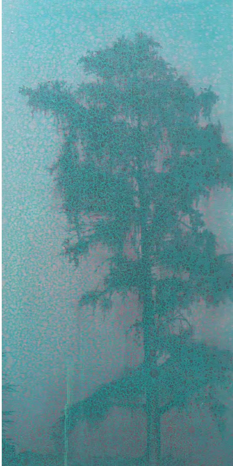
Savia roja, óleo-lino, 80x40, 2016