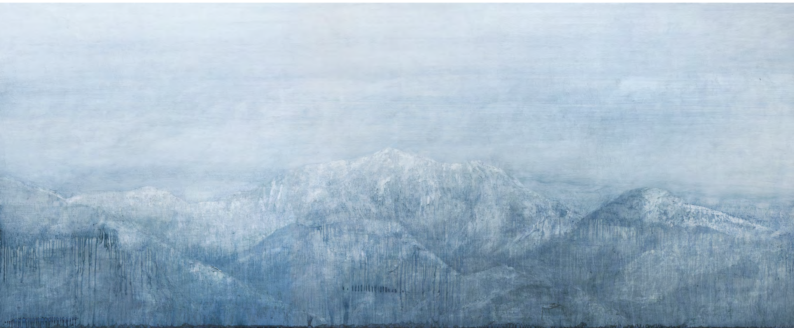
Winterreise de Schubert II, óleo-tabla, 82,5x203, 2016