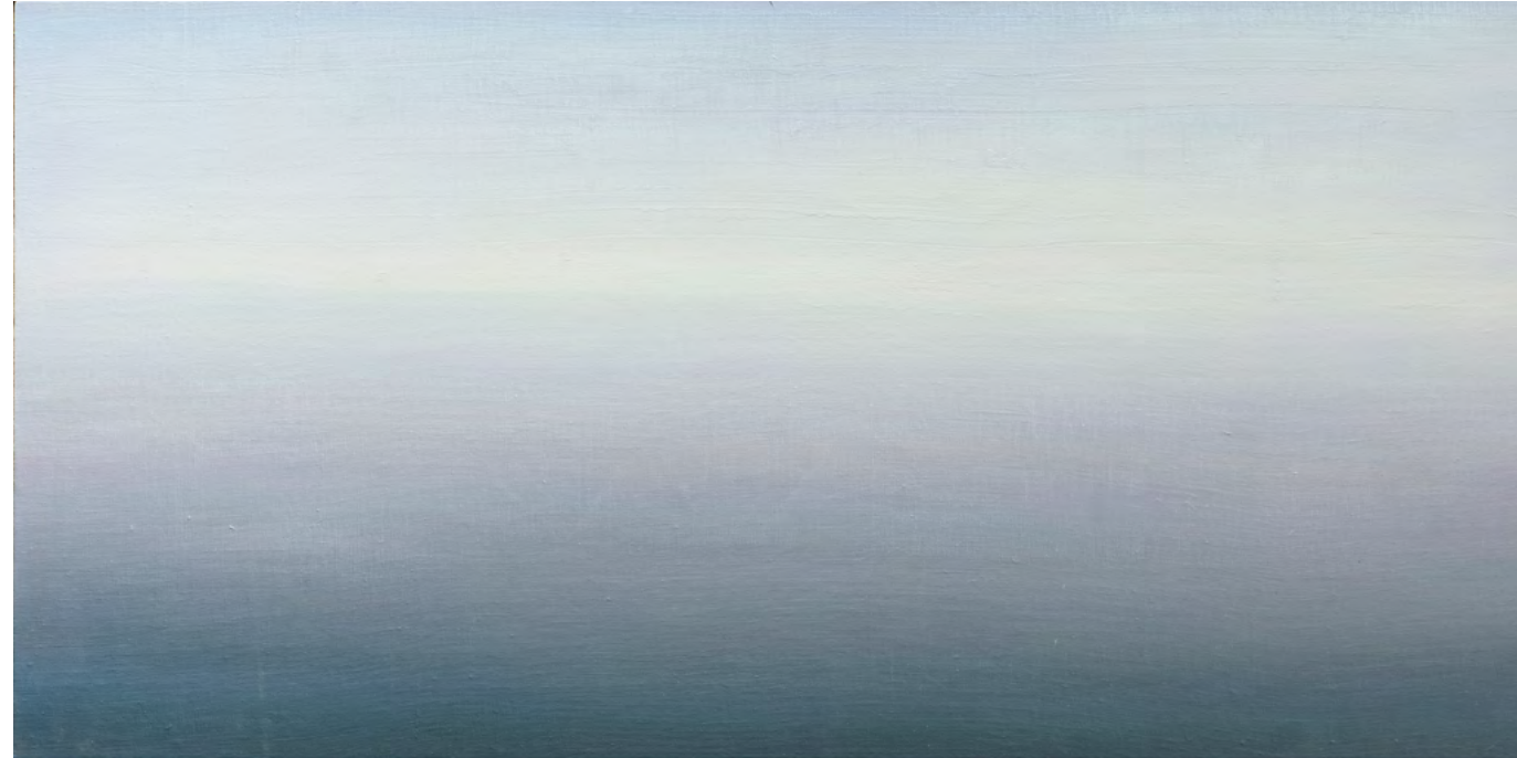
Mar olvidado, 50x100, 2016