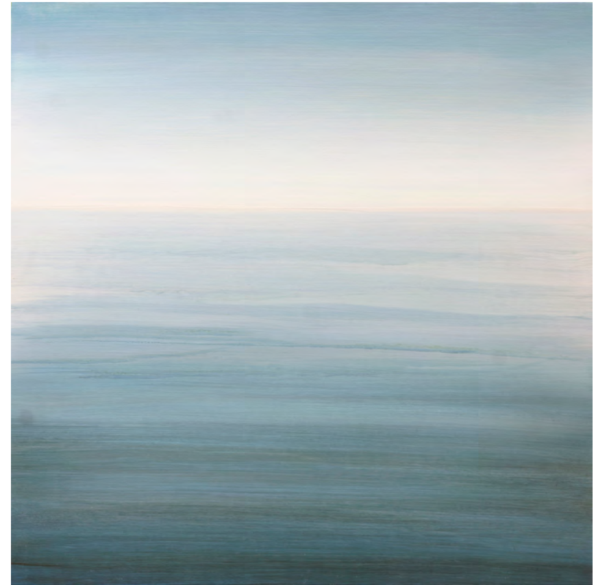
Ver el mar II, óleo-tabla, 70x70, 2016

Las palabras regresan. Rompen contra el límite azul de mi gramática, porque aquí no hay ayer ni mañana ni ahora, sólo este sucederse inmemorial del espejo del mar ante mis ojos.