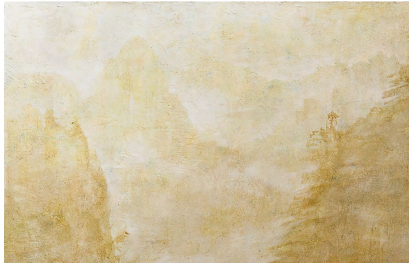
Turner en Oriente, óleo-lino, 114x146, 2016