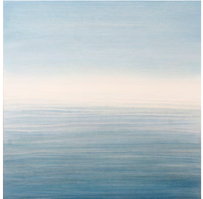
Ver el mar III , óleo-tabla, 70x70, 2016