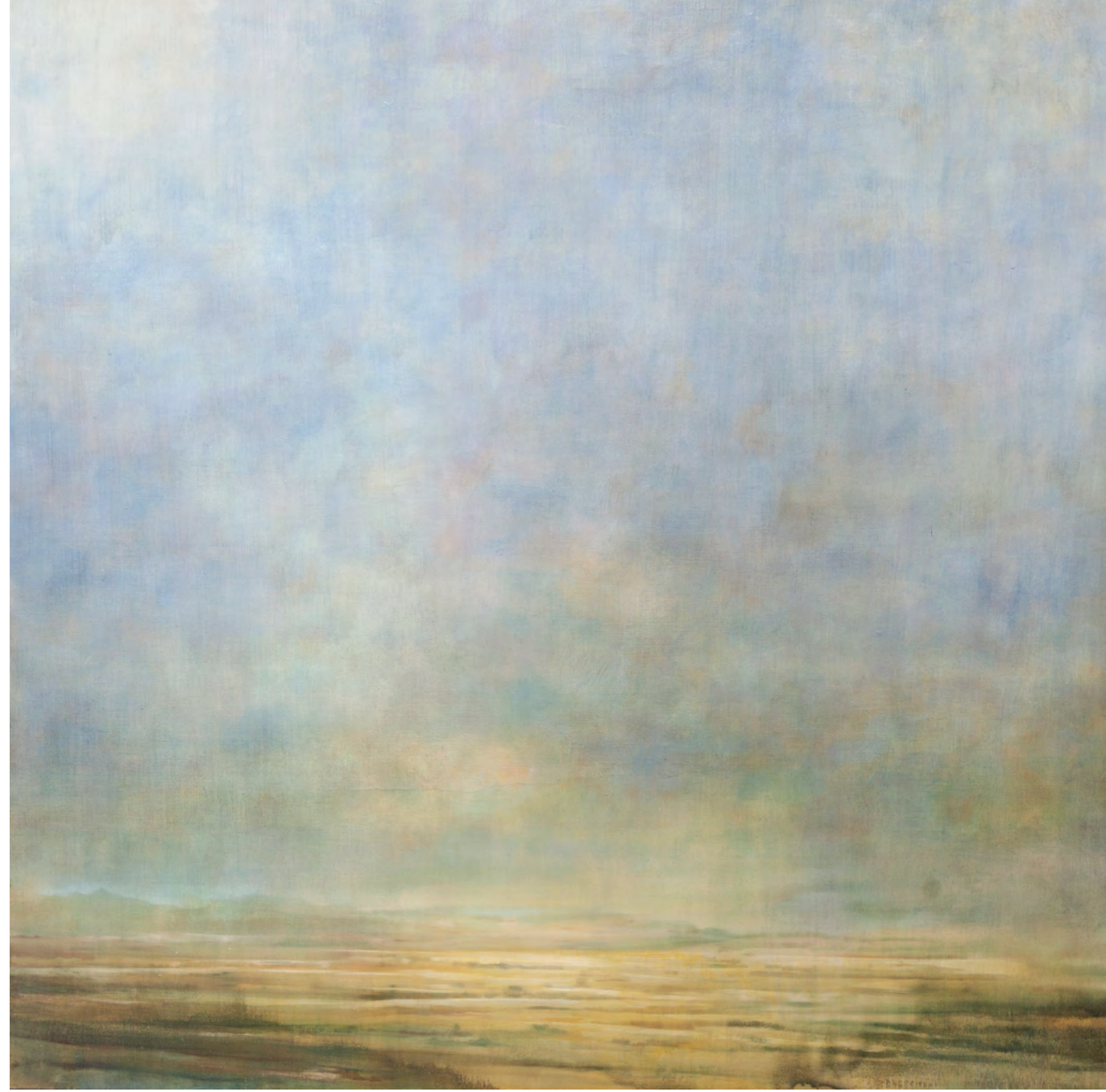
Momentos sucesivos I, óleo-lino, 195x195, 2016