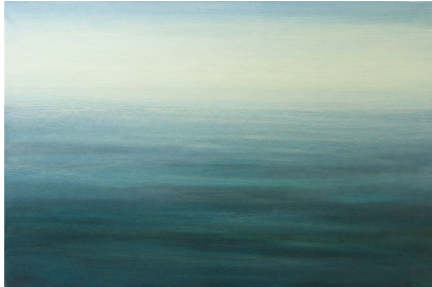
Ver el mar I, óleo-lino, 97x146, 2015-16

La rectitud no existe, el mar se riza y vuelve sobre sí cualquier camino.