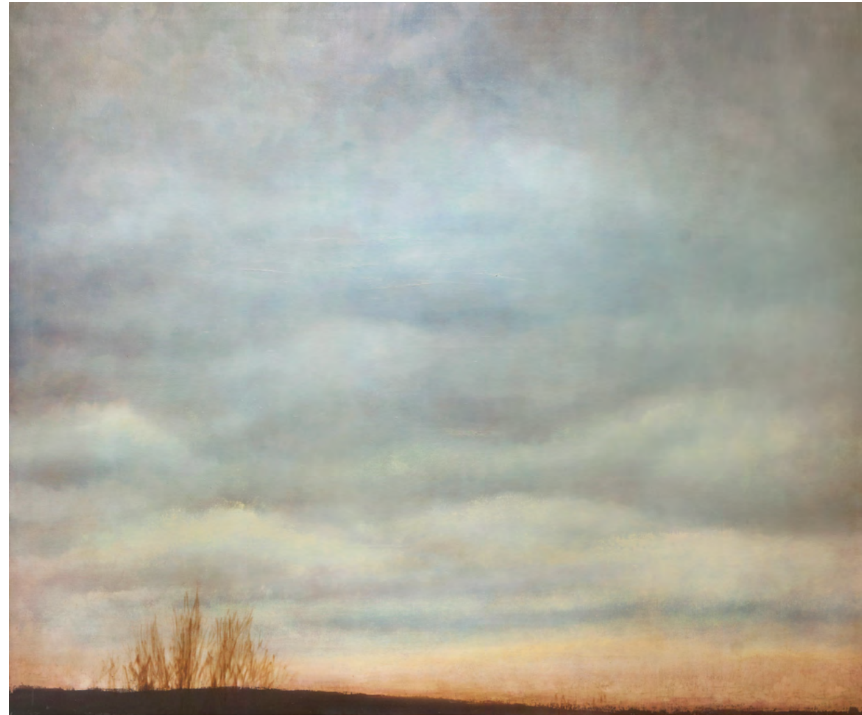
Antes de que anochezca, óleo-lino, 162x195, 2015

Intentas aprenderte la lección mientras la luz, antes de que anochezca.