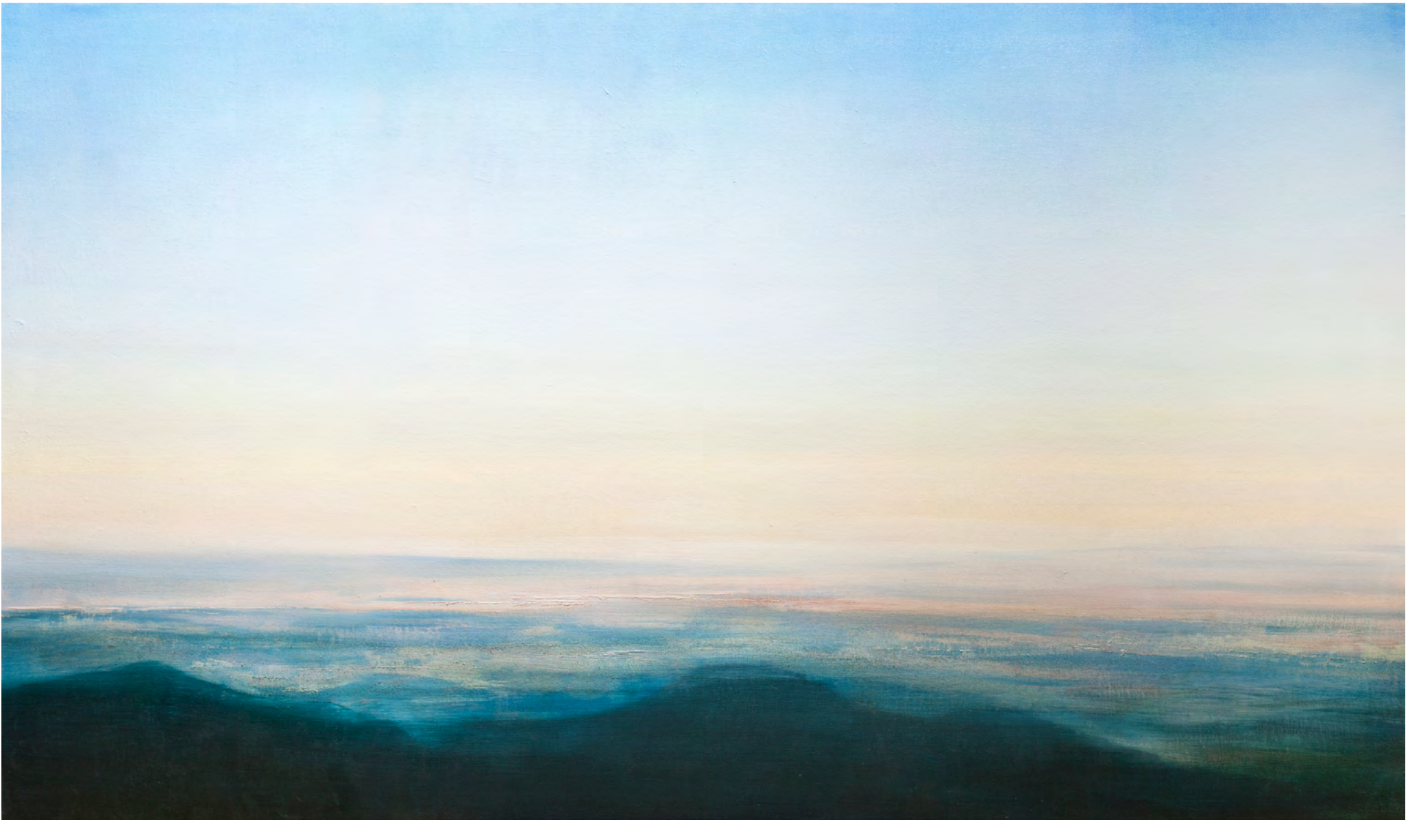
A lo lejos (Mirador de Rebalsadores) óleo-lino, 114x195, 2016