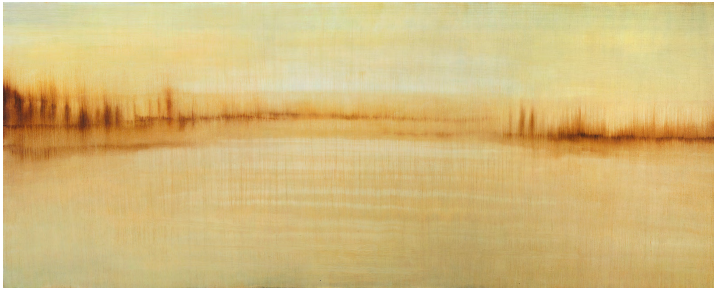
Alborada II, óleo-tabla, 82,5x203, 2015