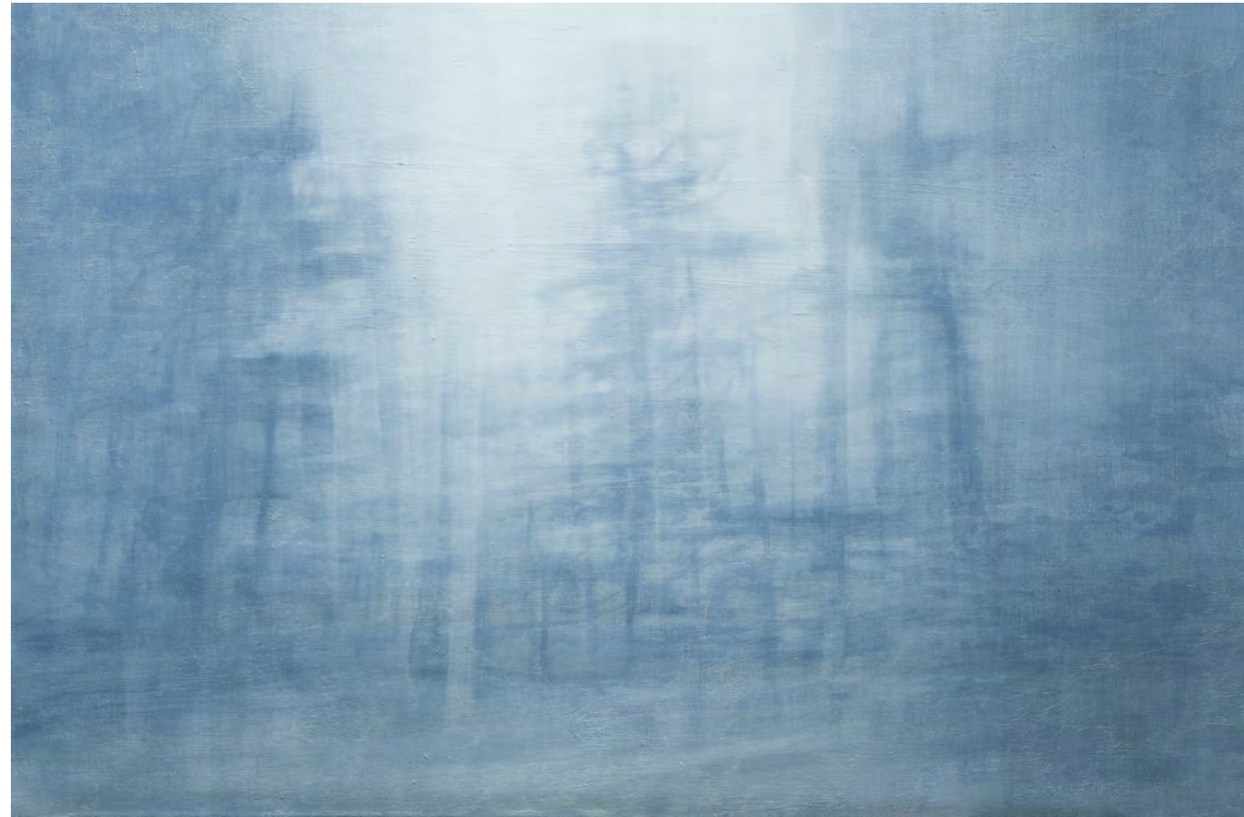
Rasgar la niebla II, óleo-lino, 53,5x80,5, 2016