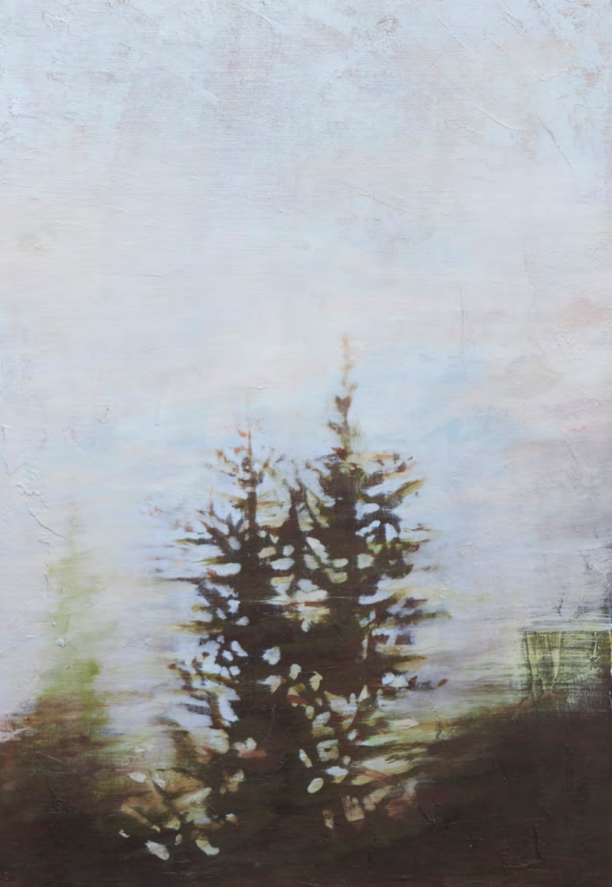
Goteo de luz, óleo-lino, 55x38, 2016