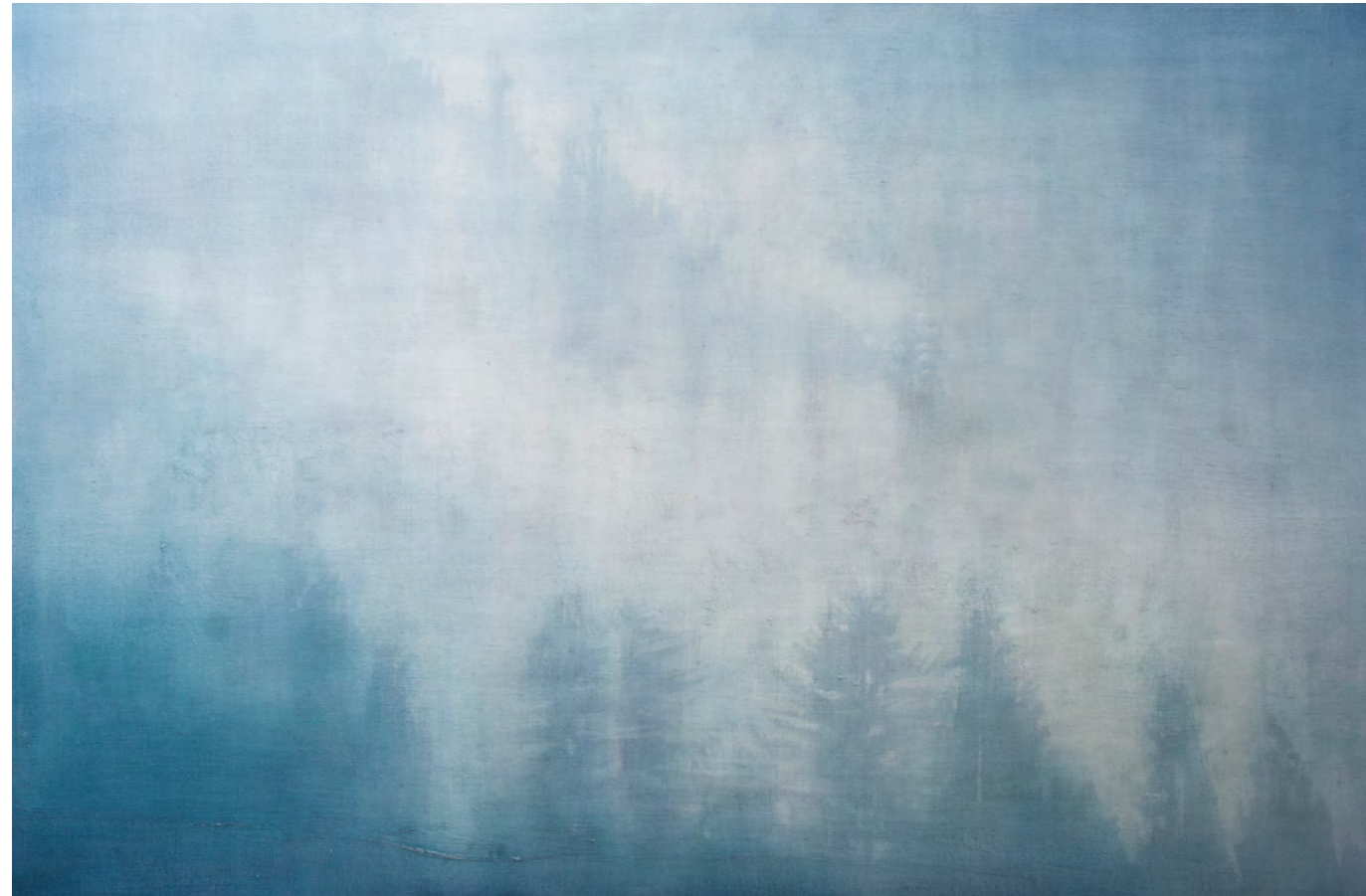
Rasgar la niebla I, óleo-lino, 97x146, 2016

En la veta más honda se vislumbra la encendida sorpresa de los ojos abiertos a lo nuevo, el camino primero de la luz, la sola salvación del laberinto.