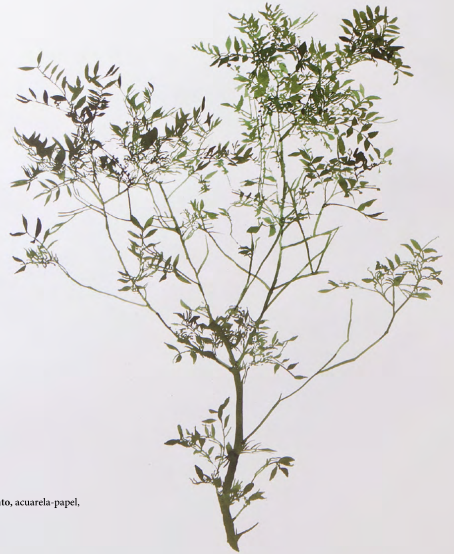
Lentisco y viento, acuarela-papel, 100x70, 2015

Mira el tronco desnudo, cómo corre por ti su misma savia.