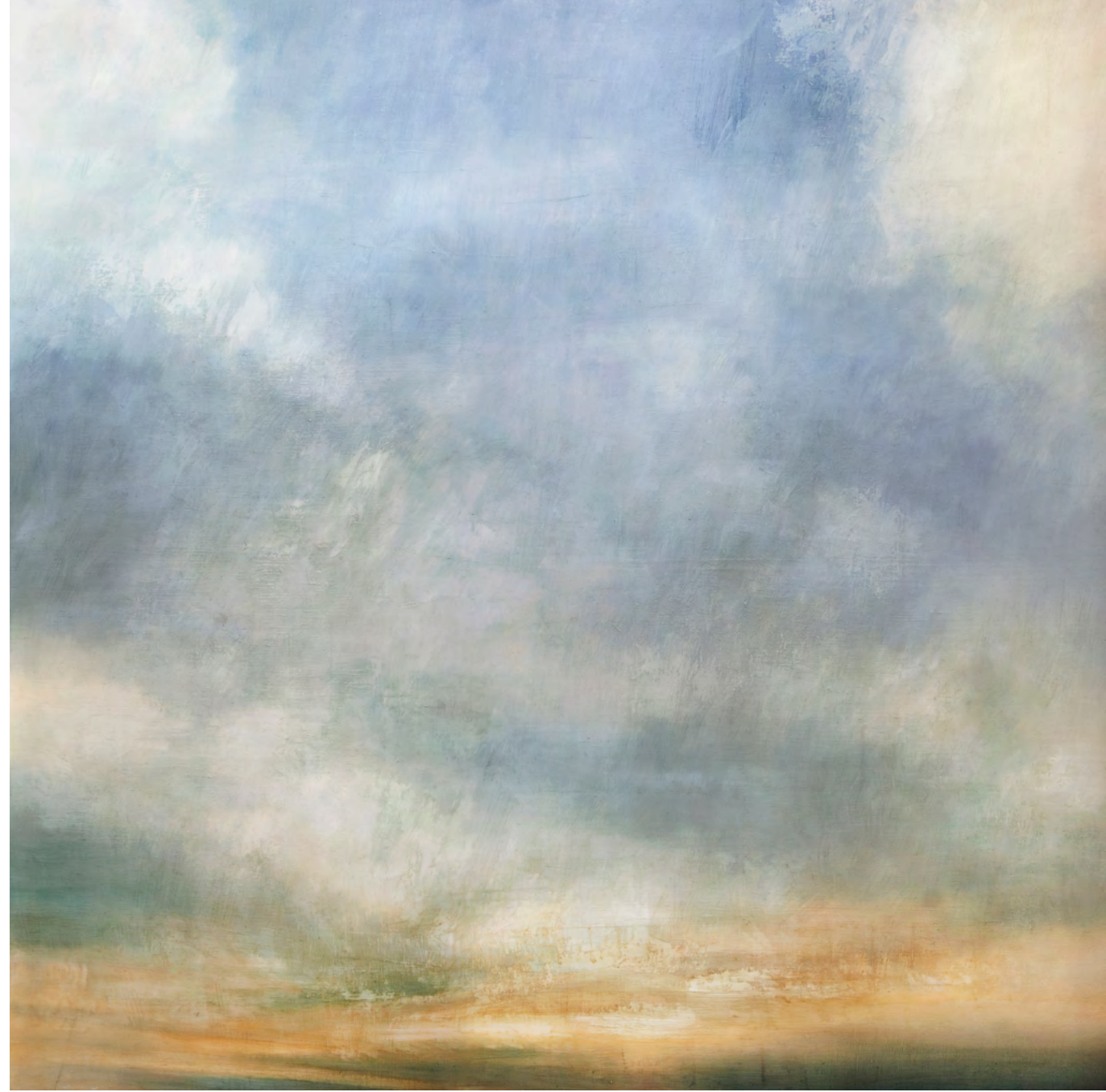
Momentos sucesivos II, óleo-lino, 195x195, 2016