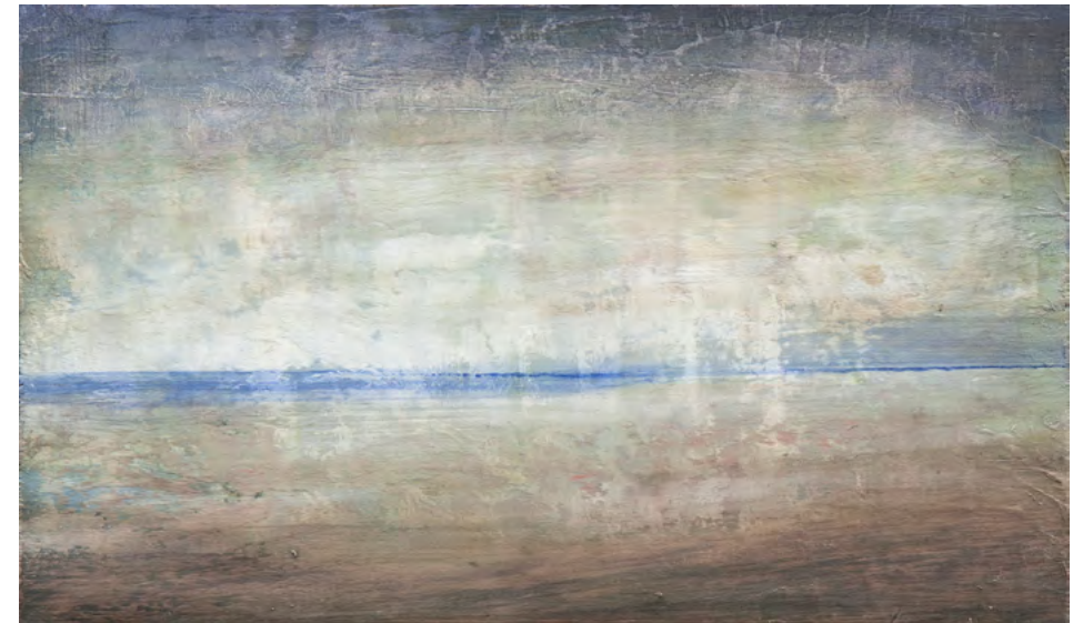
Playa, óleo-tabla, 30x49, 2016

Es hora de partir y derramarse, penetrar las arenas permeables del mundo, rebrotar embebidos de nuevo al manantial en el líquido amor de cuanto fluye.