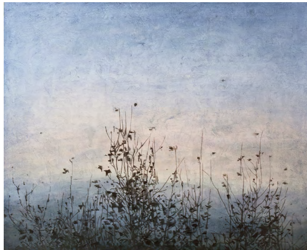
Mirador con ramas, óleo-tabla, 81x100, 2015-16