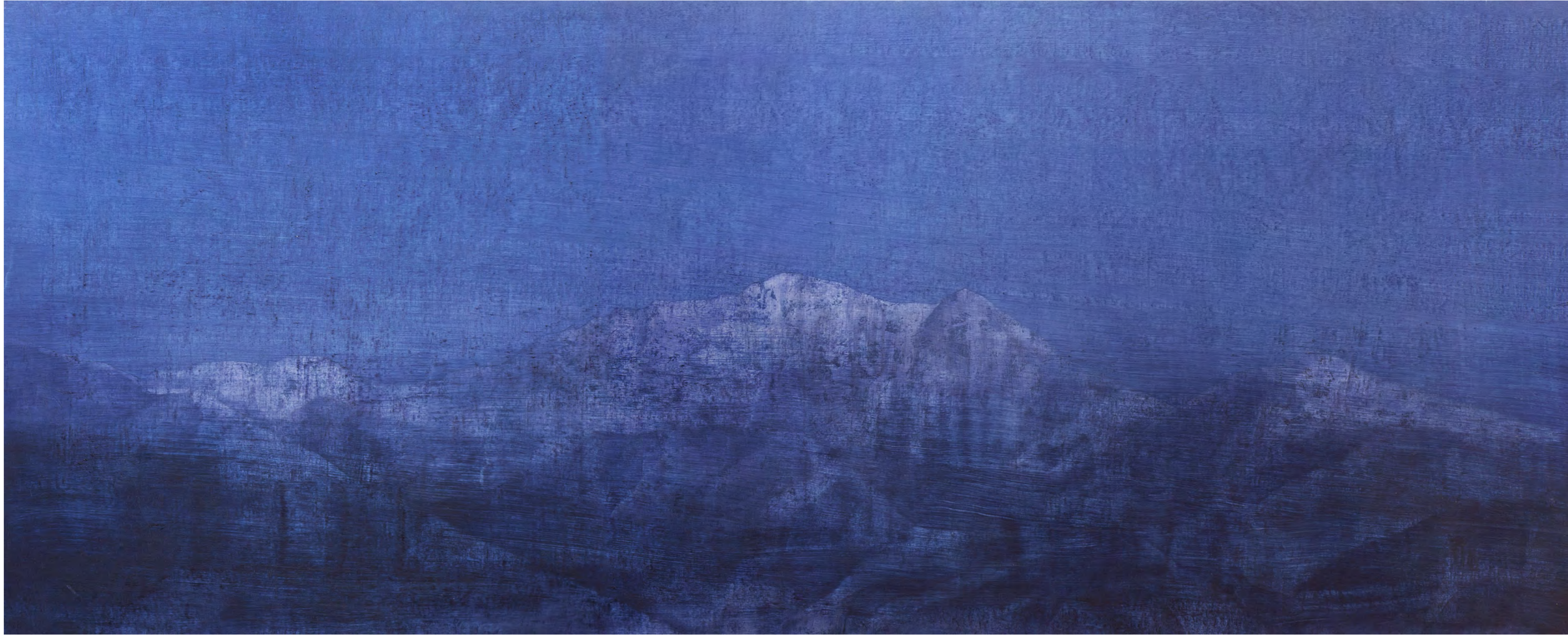
Winterreise de Schubert I, óleo-tabla, 82,5x203, 2016